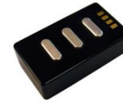
乾式(乾式、3軸加速度センサ)