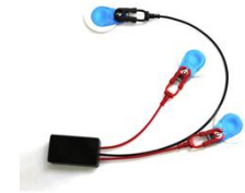
湿式(湿式、3軸加速度センサ)