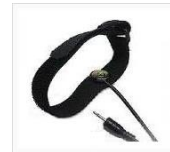
リファレンス電極バンド LP-IDREF01 ¥6,000(税別)